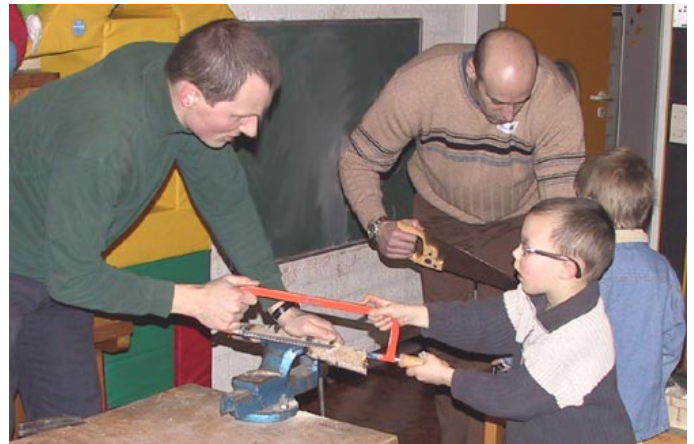
Wie kriegen wir das durchgesägt?

Die Frühförderung bietet monatliche Elterngesprächsabende unter familientherapeutischer Leitung an. Das gewünschte Themenspektrum reicht von Erziehungsthemen, der Akzeptanz der Behinderung bei sich selbst und beim Umfeld, Geschwistersituation bis zur gegenseitigen Unterstützung in dem Bewusstsein, beim Leben mit der Hör-